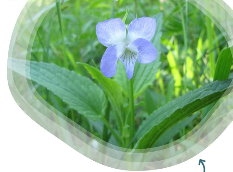
Viola elatior

Cernay : Assemblée générale (réservée aux membres CEN Alsace) puis Journée festive des 50 ans du CEN Alsace (table ronde, visite guidée, concert, pièce de théâtre, stands, restauration)