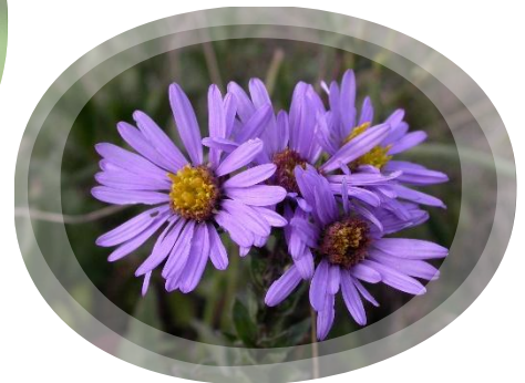
Aster amellus

"MIEUX CONNAITRE C'EST MIEUX PROTÉGER !"