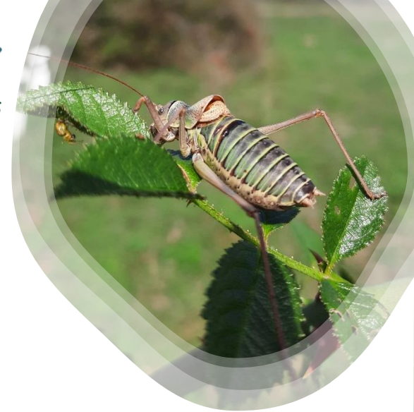
Ephippiger diurnus