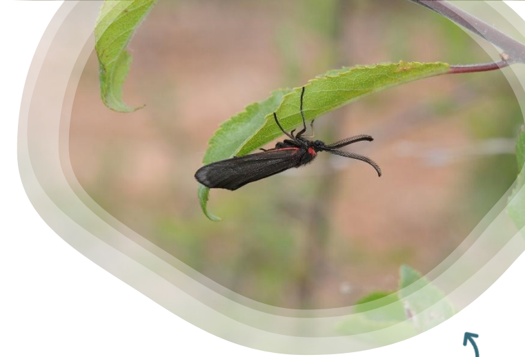
Aglaope infausta

Le Bollenberg et les autres collines de la région de Rouffach sont connues pour abriter les seules stations d' Aglaope infausta d'Alsace. Venez nous aider à rechercher les chenilles facilement reconnaissables de ce Zygène, typique des milieux secs.