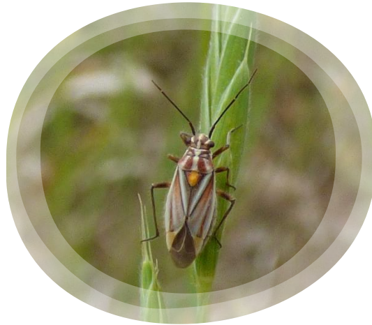
Horistus orientalis