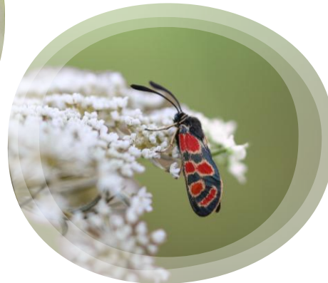
Zygaena carniolica