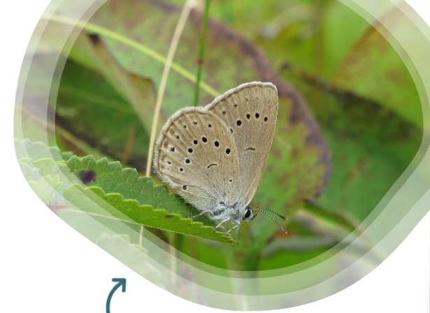
Phengaris teleius

Venez participer au suivi de la flore des rives de la Moder. Attention, zone humide difficile d'accès, bottes, hautes-bottes ou waders nécessaires !