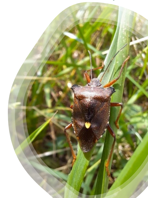
Pentatoma rufipes