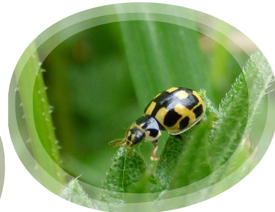
Propylea quatuordecimpunctata