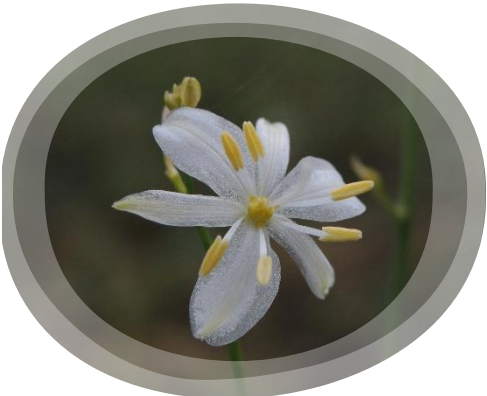
Anthericum ramosum