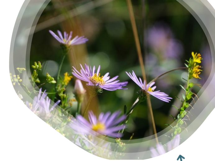
Aster amellus et Odontites luteus

Venez participer au suivi de ces espèces, respectivement en danger et quasi-menacées sur la liste rouge de la flore d'Alsace, afin de nous aider à évaluer leur état de conservation sur les pelouses conservatoires.