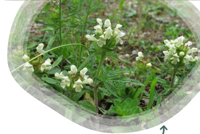
Prunella laciniata

Et si vous nous aidiez à actualiser et compléter l'inventaire des insectes des pelouses sèches et vergers ? Que papillons, punaises et autres petites bêtes n'aient plus de secrets pour vous ou non, munissez-vous de vos clés d'identification et de vos filets, et venez nous rejoindre !