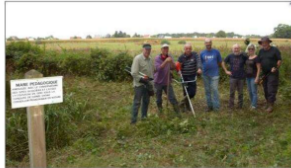
Les bénévoles en action.

Sept bénévoles – dont cinq anciens élus municipaux – actifs de-