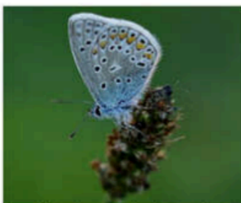
Un azuré s'est posé sur une sanguisorbe.

Comment est né l'espace naturel sensible du Liebfrauenthal ? Cet ancien pinculture a été restauré par le Parc naturel régional des Vosges du Nord dans le cadre du programme européen Life-Biocorridors, qui recrée des corridors écologiques. En 2021, les anciens bassins ont été arrachés et des travaux ont permis de retrouver le profil naturel de la prairie, qui a été réensemencée avec des végétaux locaux. Au