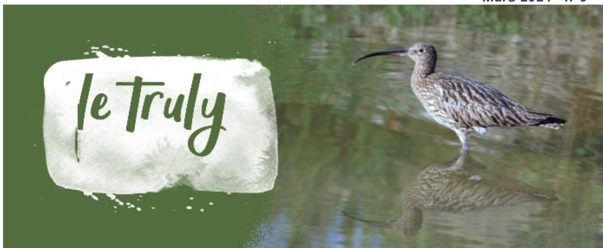
Courlis cendré ( Numenius arquata )