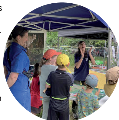
Stand lors de l'événement Faut qu'on s'bouge