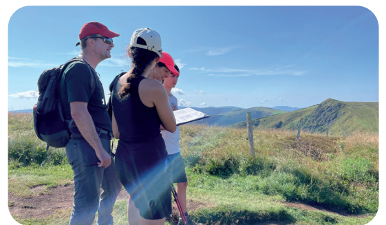
Enquête auprès des usagers de la RNR des Hautes Chaumes du Rothenbach