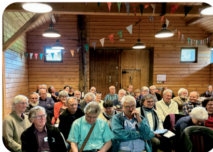
Assemblée générale au Rothenbach