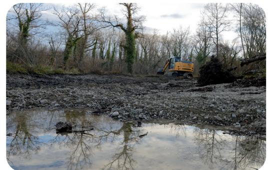
Etrépage pour remettre en eau un ancien bras du Giessen, à Kunheim.