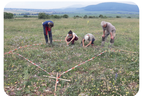
Suivi participatif dans la RNR des Collines de Rouffach