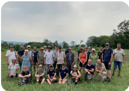
Journée des conservateurs bénévoles le 29 juin à Rosenwiller

8 606 heures de bénévolat , valorisées à hauteur de 185 234 €