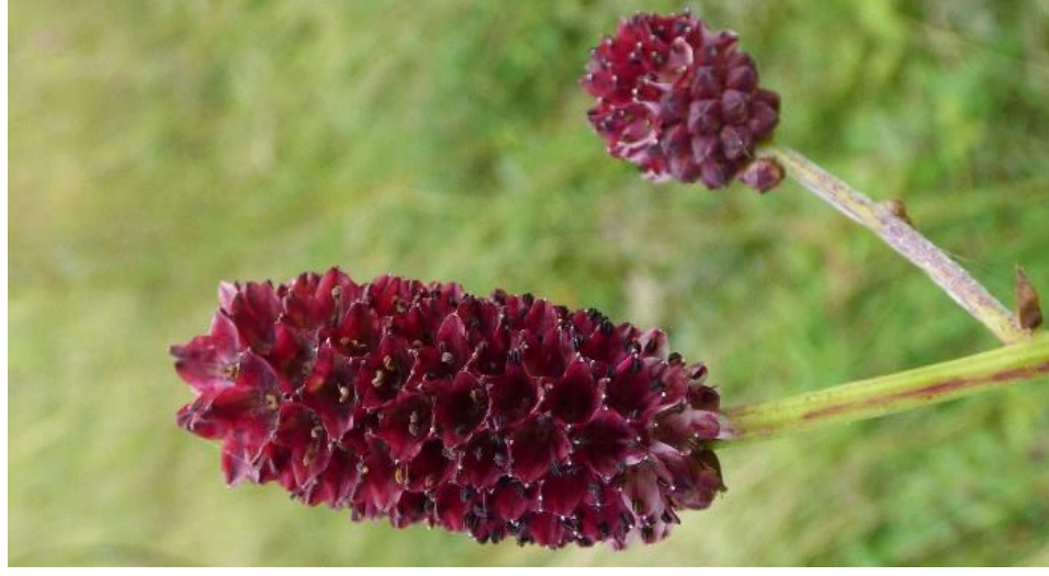
Inflorescences pourpres, ovoïdes et denses. Les étamines ne dépassant pas du calice.