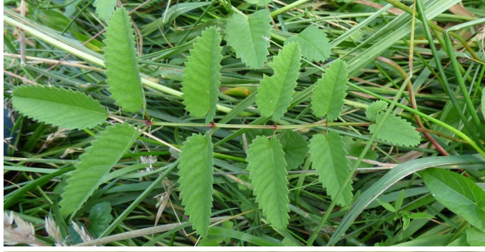
Feuille à folioles dentés.