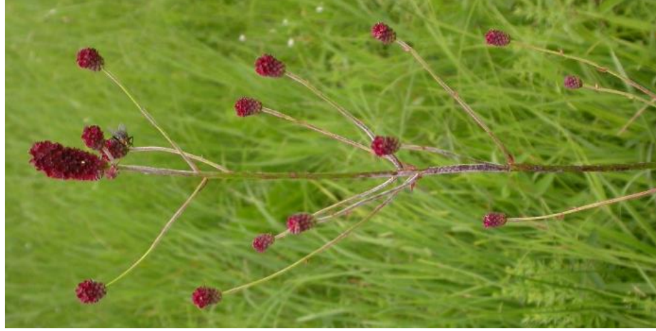
Tige florifère dressée, glabre et rameuse.