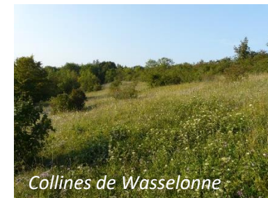
Collines de Wasselonne

La date précise sera communiquée aux intéressées en fonction des conditions météo