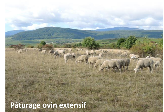
Pâturage ovin extensif