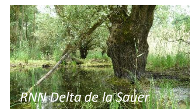
RNN Delta de la Sauer