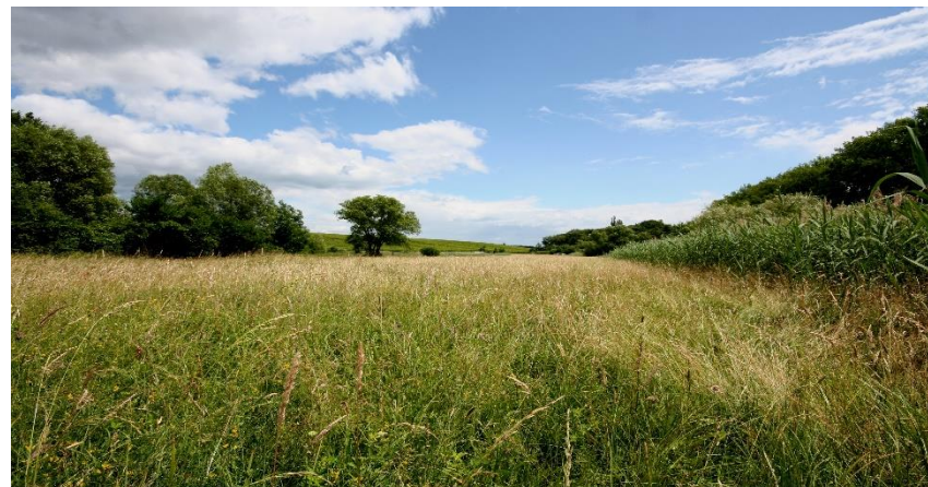
Ried de la Schernetz - Blienchtwiller - Thalmatten 66,93 ares - Acquisition