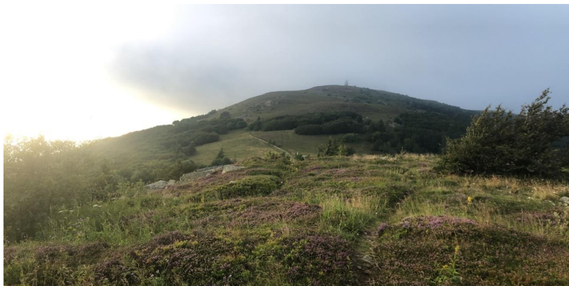
Hautes Vosges - Goldbach - Bieswald 110,94 ares - Bail emphytéotique