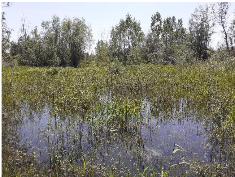
Sundgau - Dietwiller - Oberes Zeltg 324,21 ares - Bail emphytéotique