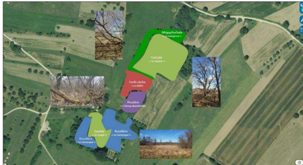
La zone humide des Kraütländer à Lutter est un espace rare qui demande d'être préservé.

Ainsi, pendant six mois, des caméras automatiques ont enregistré le passage de cinq mammifères. Dans le montage vidéo de 4 minutes présenté, le public a découvert la présence d'un chat forestier mais aussi d'un « chaton d'un chat forestier, ce qui est assez rare » ; d'un blaireau, très courant dans le Sundgau, qui rapporte un fagot de paille