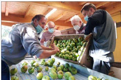
Comme l'an dernier, il est possible de faire son jus à partir de ses propres fruits (pommes et poires) au pressoir de la Maison de la nature du Sundgau, à Altenach.

C'est donc dans une installation performante et rénovée récemment que la Maison de la nature du Sundgau attend les habitants pour venir presser les pommes et les poires des vergers ! Car il n'y a pas meilleur jus que celui que l'on