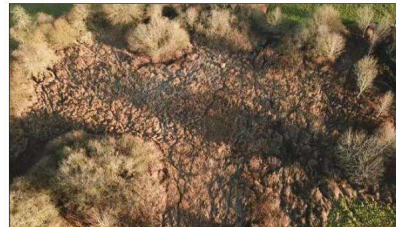
Les Krautländer, zone humide et interface entre milieux, à l'extrémité orientale du massif forestier du Jura alsacien, recèlent une faune riche, immortalisée par les vidéos captées par la MNS.

La zone humide des Krautländer est un milieu intéressant à plusieurs titres. Composée d'une roselière, d'un vieux étang, d'une carrière, dans le prolongement d'un bois, elle se situe à l'extrémité orientale du massif forestier du Jura alsacien, zone