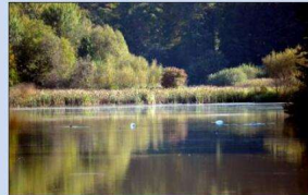
Observation des oiseaux aux étangs Nérac, ce dimanche 3 octobre. Archives Le Pays

Après dix-huit années de suivi sur le site et près de 5000 oiseaux bagués, les étangs Nérac continuent d'offrir chaque automne leur lot de surprises, oiseaux locaux ou espèces qui font étape lors de leur migration. Ce dimanche 3 octobre, en plus de la découverte des oiseaux, le public pourra échanger avec les ornithologues chargés du bagage.