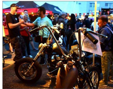
Les passionnés des deux-roues à moto ont rendez-vous à Bâle du 16 au 17 juillet.

Y ALLER Biker days de Bâle, accès libre, du vendredi 16 juillet à partir de 17 h au dimanche 18 juillet au soir. Sankt Jakob, 4052 Basel. Renseignements au +41.79.340.15.64 et par courriel : info@bikerdays-basel.com