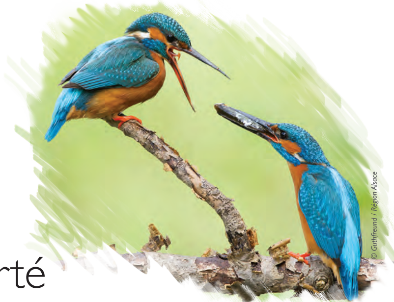
Couple de Martins-pêcheurs