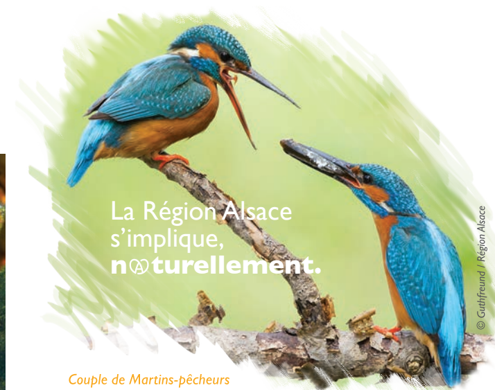
Couple de Martins-pêcheurs

Réserve Naturelle Régionale EIBLEN ET ILLFELD À RÉQUISHEIM