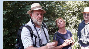
Les visiteurs ont particulièrement apprécié les sorties nature en petit groupe.

« Par rapport à d'autres territoires, on s'en sort bien »