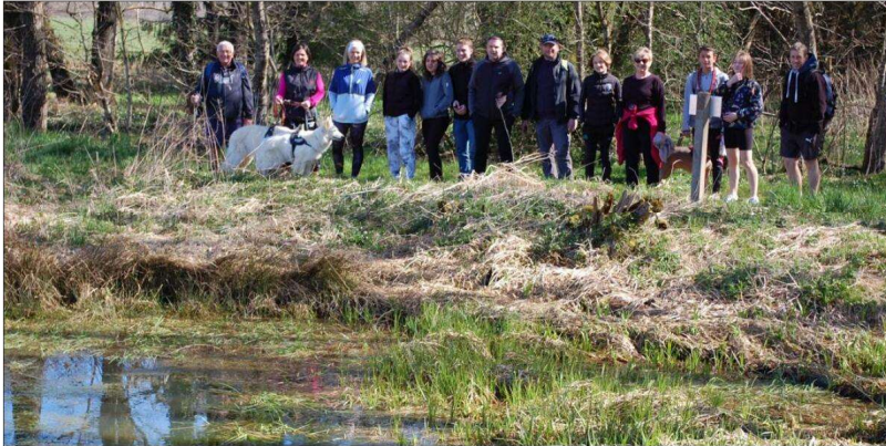
Un groupe de marcheurs du Club vosgien devant la mare pédagogique, créée voilà trente ans sur le lit majeur de la Gruebaine.

Le Club vosgien réactualise ses plaquettes directionnelles avec des panonceaux informatifs, des éléments patrimoniaux ou historiques que des milliers de randonneurs découvrent chaque année, sur les trois itinéraires inaugurés en 2007 à Chavannes-sur-l'Étang.