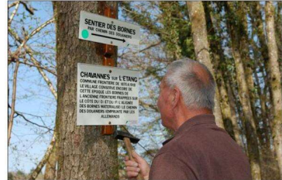
Faire connaître l'histoire et le patrimoine du secteur : c'est l'objectif de ces nouveaux panonceaux informatifs installés sur les sentiers balisés par le Club vosgien.

heures de bénévolat pour l'entretien de nos sentiers. » La mise en place de panonceaux informatifs est ici un plus car l'inspecteur des sentiers consacre beaucoup de temps à écrire lettre après lettre sur les écriteaux et modifier les parcours quand il y trouve un intérêt particulier. Sans compter tous ses déplacements dominicaux afin d'ouvrir un chemin obstrué par des arbres et branches ou pour débroussailler des tronçons envahis de ronciers ou de hautes herbes. C'était encore le cas encore ce printemps dans les forêts de Chavannes.