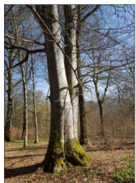
Un arbre remarquable sur le chemin.