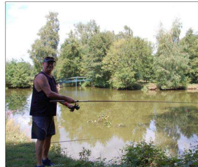
L'étang communal de Belle-Île invite à la pêche dans un cadre idyllique.