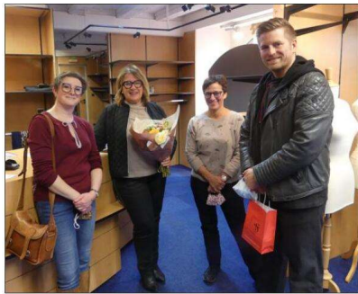
Avec les amis de Kom'in KB venus lui souhaiter bonne retraite.

Dans sa jeunesse, elle aimait « créer et bricoler » avec sa grand-mère couturière et en a gardé un amour pour les étoffes et les vêtements. Après ses études pourtant, elle prit le chemin de la banque, pour un poste d'employée à mi-temps. Mais à 40 ans, cette maman de deux enfants veut tourner une grande page et la voilà gérante de la Maison Gisie - Vêtements Femmes et Hommes. « Je n'y connaissais pas grand-chose et c'est l'employée de la maison qui a su avec patience et amitié me trans-