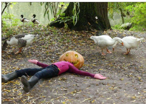
Halloween est bien moins horrible que les dangers qui menacent la biodiversité.

M ême si les animaux sont toujours bien présents dans le parc du Naturoparc, à Hunawihr,