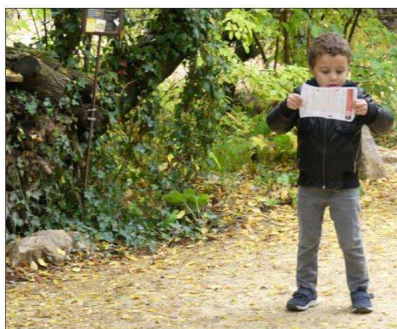
Mais où est donc ce « Schwarzi Daïfel » ?