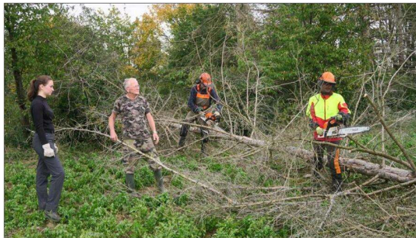
15 m 3 d'épicéas seront abattus et ébranchés avant valorisation.