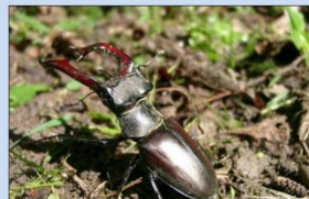
Le lucane cerf-volant est le plus gros scarabée volant d'Europe. Document remis

la forêt d'Offendorf. À l'achèvement de la centrale d'Ifhezheim, au Nord-Est, en 1977, le site est coupé de sa liaison rhénane et privé de la dynamique des crues et de leur apport en sédiments nutritifs. Le Rossmoerder, un bras du Rhin qui irrigue le massif forestier via deux diffusions, voit son débit se tarir et sa vie aquatique devenir moins foisonnante. Toutefois, les lieux connaissent toujours des inondations au début de l'été du fait des remontées de la nappe