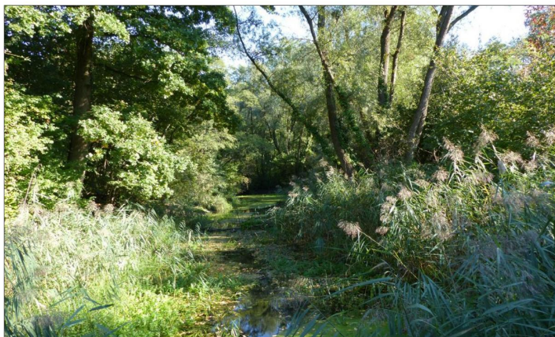
La réserve naturelle d'Offendorf a été créée en 1989.